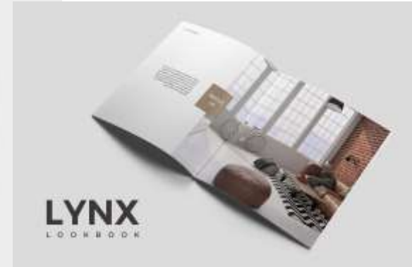
※ Lynx Lookbook Template by Slide Station