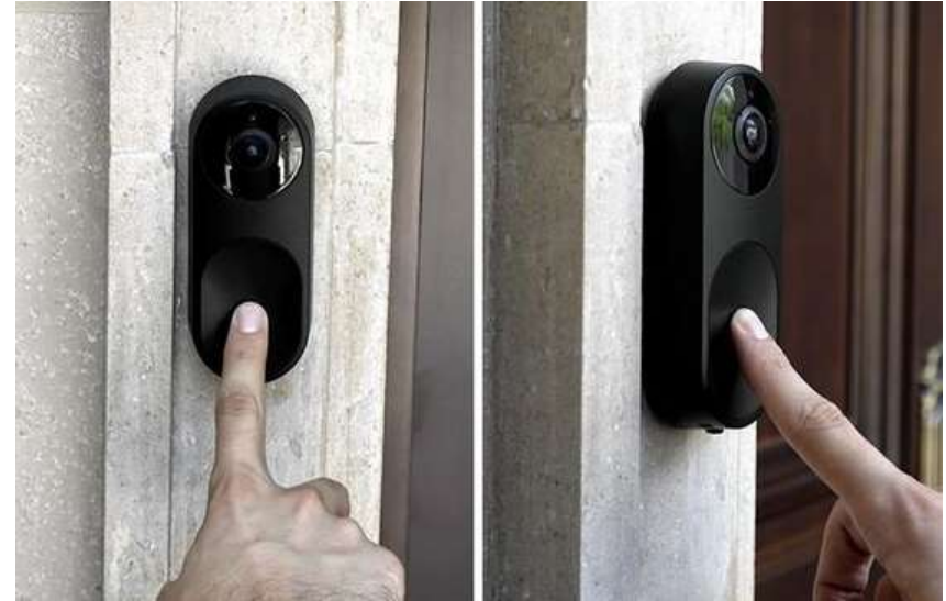
※ Yanko design - form Beyond Function